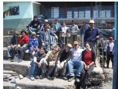
Minga=Compartir: comuneros de la Esperanza y voluntarios, agosto 2007