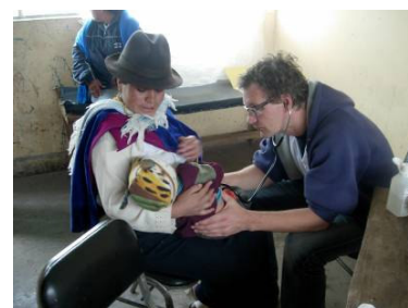
Brigada medica Esperanza, Nov. 2007

Los habitantes de las comunidades indígenas difícilmente se trasladan a un hospital, de hecho por tradición o cultura prefieren dar a luz en casa. Por esta razón, la finalidad del curso fue proporcionar mayores instrumentos y conocimientos a las personas de la localidad para poder ayudar a las mujeres embarazadas a saber y reconocer los principales factores de riesgo .