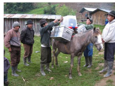
La medicina llega a Guangras