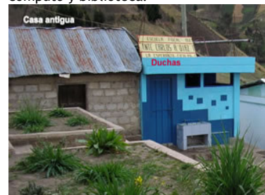
A la izquierda antigua cocina para niños pequeños, a la derecha las duchas colocadas en el 2006.