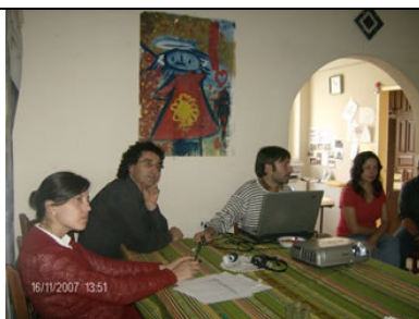
Algunos momentos de la reunión anual