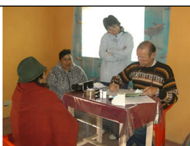
Brigada médica, Cochaloma agosto 2007