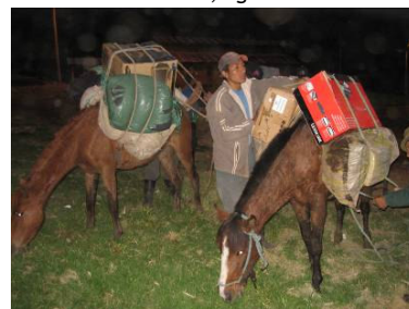
El primer computador llegó a la Comunidad de Guangras después de 9 horas a caballo, Noviembre 2007