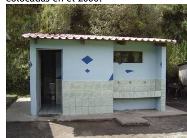
El baño de la escuela básica de Pilahuaico remodelada y entregada en el mes de mayo del 2007.