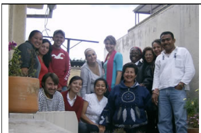
El grupo de voluntarios del Programa Guagua, noviembre 2007

AVISO AL PADRINO: Hemos comenzado a recibir cartas y regalos para sus ahijados de forma más frecuente. Agradecemos de corazón e invitamos a quien todavía no lo ha realizado a escribir a su ahijado y enviarle una foto. Recordamos que la relación entre padrino y ahijado es directa y fundamental para el desarrollo de una relación de confianza. Un favor: no enviar paquetes con peso superior a 2 kg para evitar problemas en la aduana y costos adicionales.