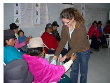
Curso para parteras, entrega del diploma Cajabamba - Chimborazo, Nov. 2007