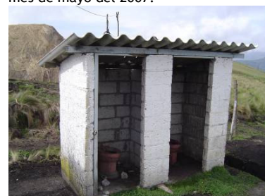
Arriba, la vieja letrina de la escuela básica de Toropamba y abajo el nuevo baño inaugurado en mayo del 2007.