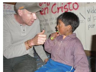
Las brigas médicas son siempre una ocasión para educar.