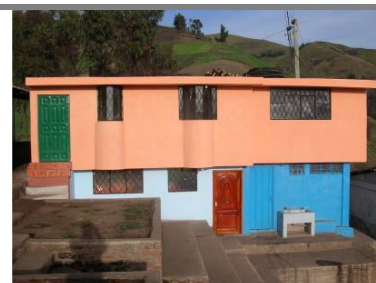
La nueva aula de Esperanza inaugurada el 24 de enero del 2008 en donde funcionará un pequeño centro de cómputo y biblioteca.

En el mes de septiembre recibimos con mucho gusto la aprobación de un proyecto presentado por el Club Rotario cuyo objetivo busca mejorar la calidad de educación intercultural bilingüe en la provincia de Chimborazo. En colaboración con el Ministerio de Educación y con la Dirección Provincial de Educación Intercultural Bilingüe de Chimborazo, logramos instalar 28 computadoras en 24 escuelas del area rural. Además, diez escuelas fueron dotadas de estructuras para los campos deportivos (arcos para fútbol y tableros de basket). Este proyecto todavía se encuentra en ejecución, actualmente se están desarrollando cursos de formación en computación dirigidos hacia los profesores, por lo que en el próximo informe detallaremos los resultados finales.