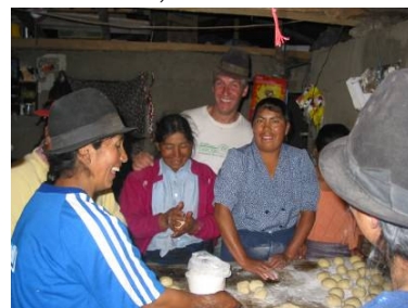
Curso de panadería en Sigchos (Prov. Cotopaxi) Octubre 2007