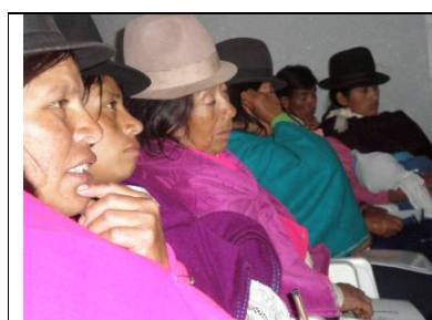
Algunas participantes en el curso de parteras, noviembre 2007.