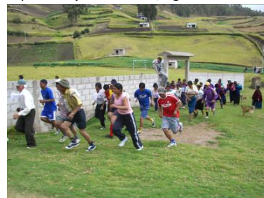
Partida de la Primera carrera de la amistad en montaña, agosto 2007.