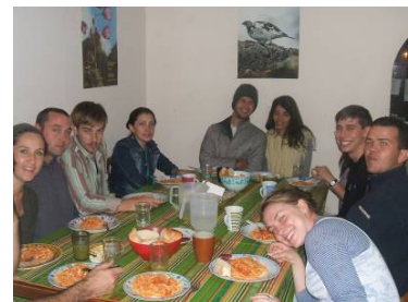
Una buena pasta en la casa de voluntarios