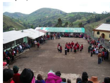
Navidad, todos reunidos en la Escuela de la Esperanza, Diciembre 2007