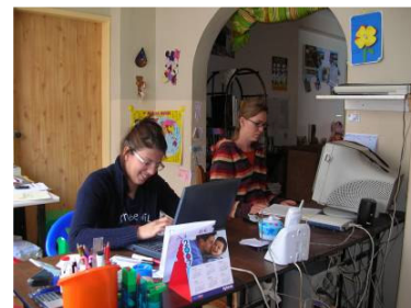
Nuestra oficina en Quito

Se nota claramente que casi la mitad de nuestras salidas pertenecen al Programa Guagua que es cubierto por las cuotas anuales de los padrinos, mientras que cerca del 19% se dirige al proyecto de asistencia o ayuda a las personas en el campo de la salud. La suma de 24.552 dolares que representa un 18% de las salidas y estuvo destinado a los proyectos de desarrollo sostenible en las comunidades indígenas de la provincia de Chimborazo, en este caso vale hacer una aclaración. De hecho en el curso del 2007 han ingresado 16.451 dolares como pago de los micro-creditos y otras entradas locales específicas por el proyecto. Por consecuencia, el costo total asignado a la ONG descendiendo a 8.100 dolares, que en términos porcentuales representa cerca del 6% del total de las salidas. Esto es una buena señal que nos hace reconocer la auto sostenibilidad económica del proyecto.