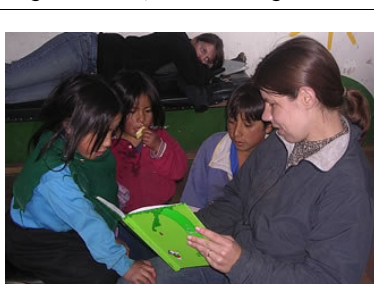
Esperanza, abril 2007