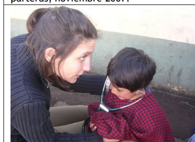
Esperanza, abril 2007