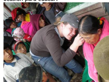
Los disturbios auditivos son comunes