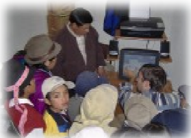
La consegna di un computer nella scuola di un villaggio (Reten)