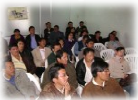
I direttori delle scuole superiori riuniti per la presentazione del progetto di miglioramento dell'alimentazione