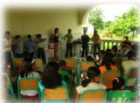
Momenti del workshop "Arte con spazzatura" a Esmeraldas