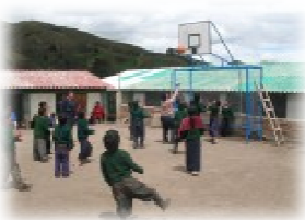
Inaugurando i nuovi tabelloni di basket a Esperanza