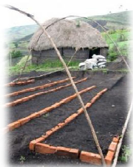
La costruzione di un piccolo vivaio per far crescere alberi nativi