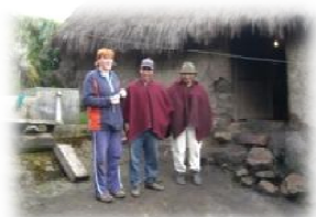
Visita a domicilio a un paziente