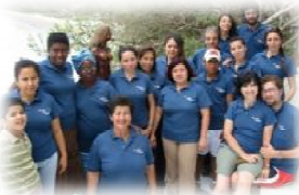
Sopra e sotto i nostri volontari riuniti per la consueta riunione annuale Guagua Convention