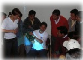
Il corso di computer organizzato a Riobamba con tutti i professori delle scuole raggiunte dal nostro progetto