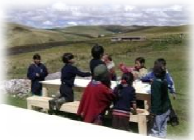
Consegnati a Toropamba tavoli per la mensa scolastica