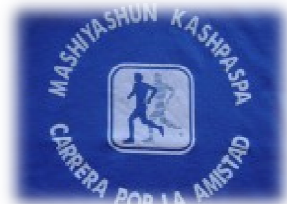
Il 9 di agosto si è svolta la seconda edizione della corsa in montagna per l'amicizia