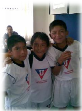
Alcuni ragazzi che frequentano il corso di calcio.