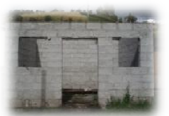
Le prime fasi della costruzione della cucina di Lupaxi Bajo

Il giorno 11 marzo 2008 abbiamo iniziato in alcuni villaggi indigeni del Canton Colta una serie di corsi di medicina naturale o ancestrale con lo scopo di recuperare le conoscenze tradizionali e l'uso delle innumerevoli piante medicinali presenti in loco.