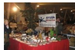
Mercatino di Natale 2008 presso il Pentagono in Bormio