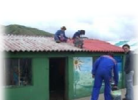
Lavori di manutenzione alla cucina della scuola di Esperanza, Agosto 2008