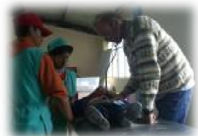
Momenti della brigada medica di agosto nei villaggi della Provincia di Chimborazo