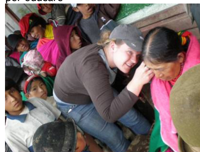
I disturbi uditivi sono diffusi