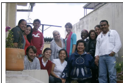
Il gruppo dei volontari impegnati nel Programma Guagua, novembre 2007

AVVISO AI SOSTENITORI: Stiamo cominciando a ricevere sempre più frequentemente lettere o regali per i vostri adottati. Ringraziamo di cuore e invitiamo chi non l'avesse ancora fatto a scrivere al proprio bambino e a mandare una foto. Ricordiamo che la relazione tra padrini e bambini è diretta. Un favore: per non incorrere in scomode formalità doganali e costi aggiuntivi non inviate pacchetti superiori ai 2 Kg.