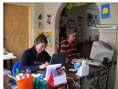
Il nostro ufficio a Quito

La somma di 24.552 dollari che rappresenta un 18% delle uscite è stato destinato ai progetti di sviluppo sostenibile nei villaggi indigeni della provincia di Chimborazo, ma anche in questo caso occorre fare una precisazione. Infatti, nel corso del 2007 sono entrati 16.451 dollari come pagamento delle rate dei micro-crediti ed altre entrate locali specifiche per il progetto. Di conseguenza, il costo totale da assegnare alla Onlus scende a 8.100 dollari, che in termini percentuali rappresenta circa il 6% sul totale delle uscite. Questo è un buon segnale che ci fa auspicare ad una auto-sostenibilità economica del progetto.