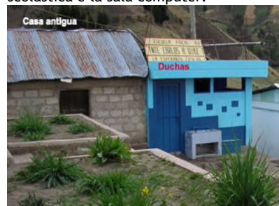
A sinistra la casa inutilizzata che esisteva prima della ristrutturazione, sulla destra le docce sistemate nel 2006.