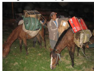
Il primo computer arriva dopo 9 ore di cavallo nel villaggio di Guangras, Novembre 2007