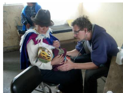
Brigada medica Esperanza, Nov. 2007

Gli abitanti dei villaggi indigeni difficilmente si recano all'ospedale, infatti per tradizione e cultura preferiscono partorire in casa. Per questa ragione, lo scopo del corso è stato quello di fornire maggiori strumenti e conoscenze alle persone locali per poter aiutare le donne in stato di gravidanza e saper riconoscere i fattori di rischio .