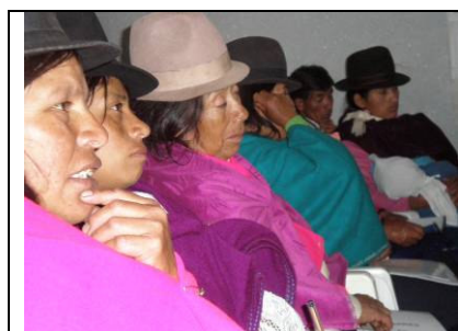
Alcune partecipanti del corso per levatrici, novembre 2007.