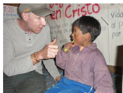
La visita medica è sempre un'occasione per educare