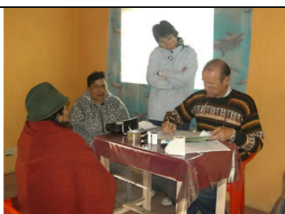
Brigada medica, Cochaloma agosto 2007