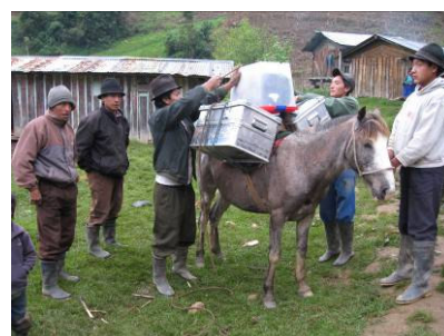
Le medicine arrivano a Guangras