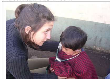
Esperanza, aprile 2007