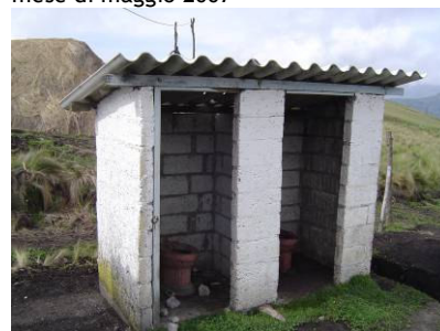
Sopra, le vecchie latrine della scuola elementare di Toropamba e sotto il nuovo bagno inaugurato nel maggio 2007