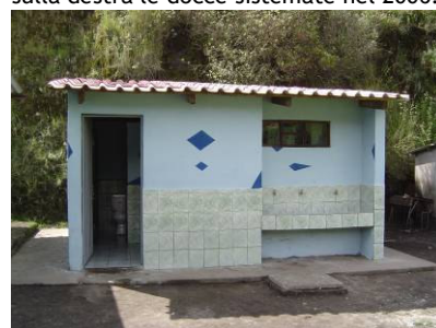
I bagni della scola elementare di Pilahuaico ristrutturati e consegnati nel mese di maggio 2007