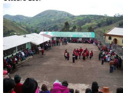
Natale, tutti riuniti nella scuola di Esperanza, Dicembre 2007