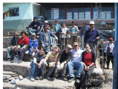
Minga=Condivisione: abitanti di Esperanza e volontari, agosto 2007