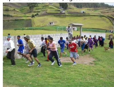
La partenza della prima corsa in montagna dell'amicizia, agosto 2007.