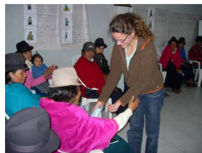
Corso per levatrici, consegna dei diplomi Cajabamba - Chimborazo, Nov. 2007