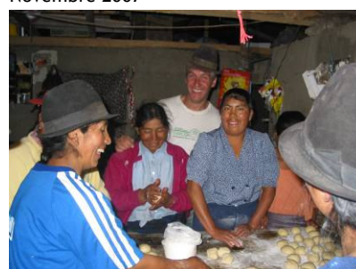
Corso di pane a Sigchos (Prov. Cotopaxi) Ottobre 2007